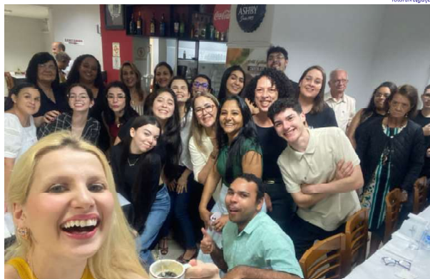
O encerramento foi um jantar de confraternização entre docentes e acadêmicos

taçou a importância do curso para a instituição: "O curso de Psicologia era um sonho antigo que se tornou realidade com excelência. Ver a qualidade das ações desenvolvidas e o engajamento dos alunos nos enche de orgulho", afirmou.