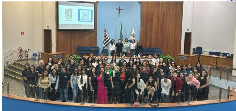
Estudantes utilizaram o Plenário "Tancredo Neves" para realizar a II Semana Acadêmica de Psicologia

Durante a abertura, o reitor Oswaldo Soler Junior des-